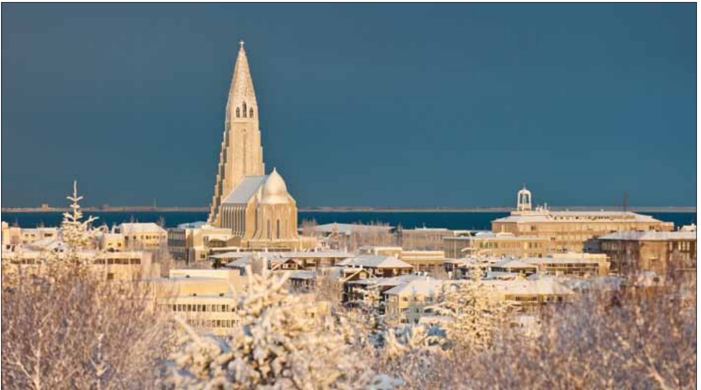
Winter in Reyjavik