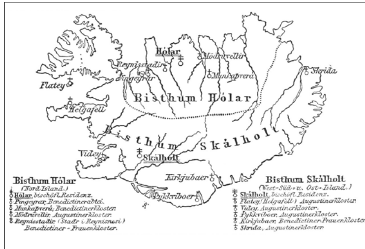
Kirchliche Einteilung Islands im Mittelalter

In der Folgezeit führten die Isländer das Christentum auf ihre eigene Weise ein. Auf dem Althing, der obersten politischen Versammlung des demokratisch-patriarchal organisierten Landes, riefen im Jahr 1000 die beiden Männer Gizur und Hjalti, die Stefnir getauft hatte, zur Annahme des Christentums auf. Fast drohte an dieser Frage die Einheit der Inselbewohner zu zerbrechen.