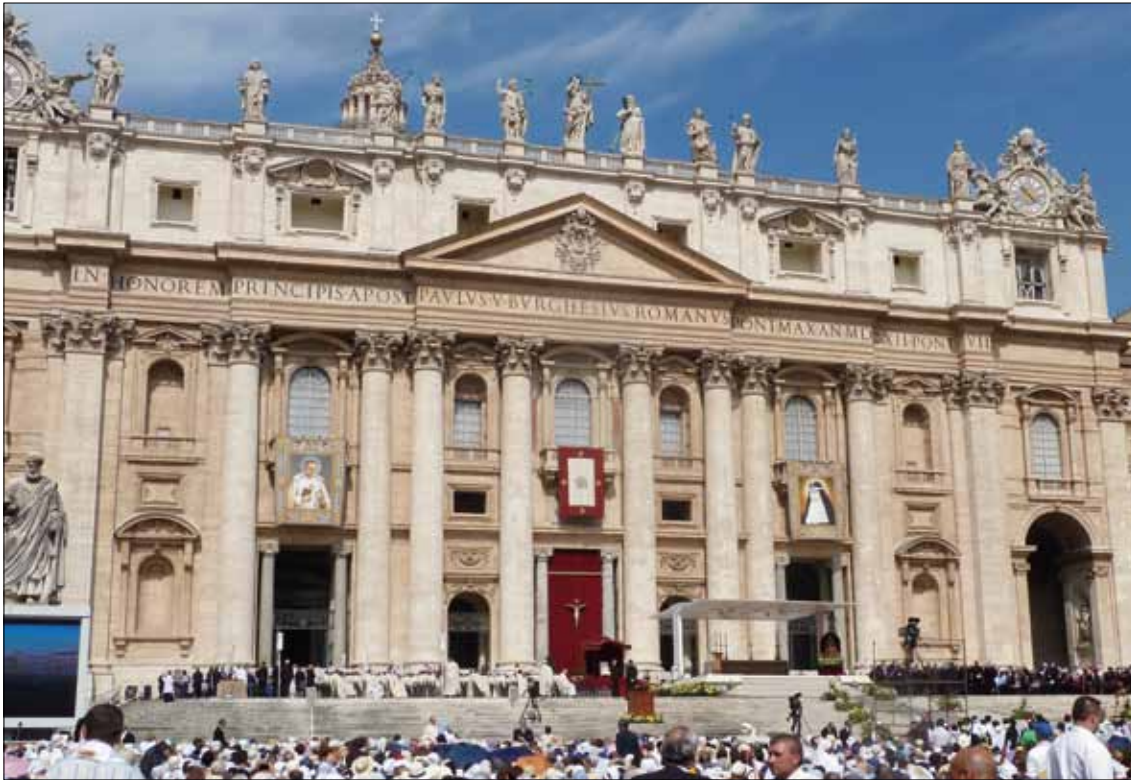
Große Kulisse zur Heiligsprechung vor dem Petersdom in Rom.