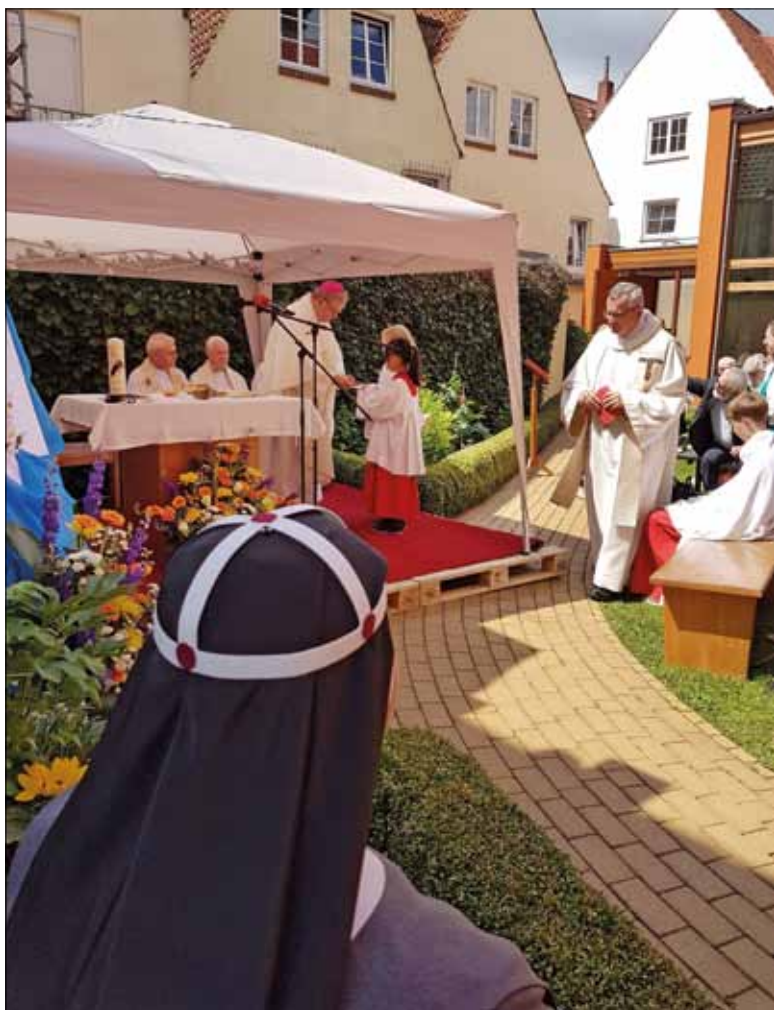
Intensive Feier mit Bischof Bode im Klostersgarten in Bremen.

die Tagaktiven laufen deshalb nicht ins Leere weil des Nachts sich Mönche zum Gebet erheben und sich Eremitinnen in die große Stille wagen alles äußerliche Treiben in der Kirche wäre nichtig und vergebens gäb es nicht die Betenden die die Innenseite leben