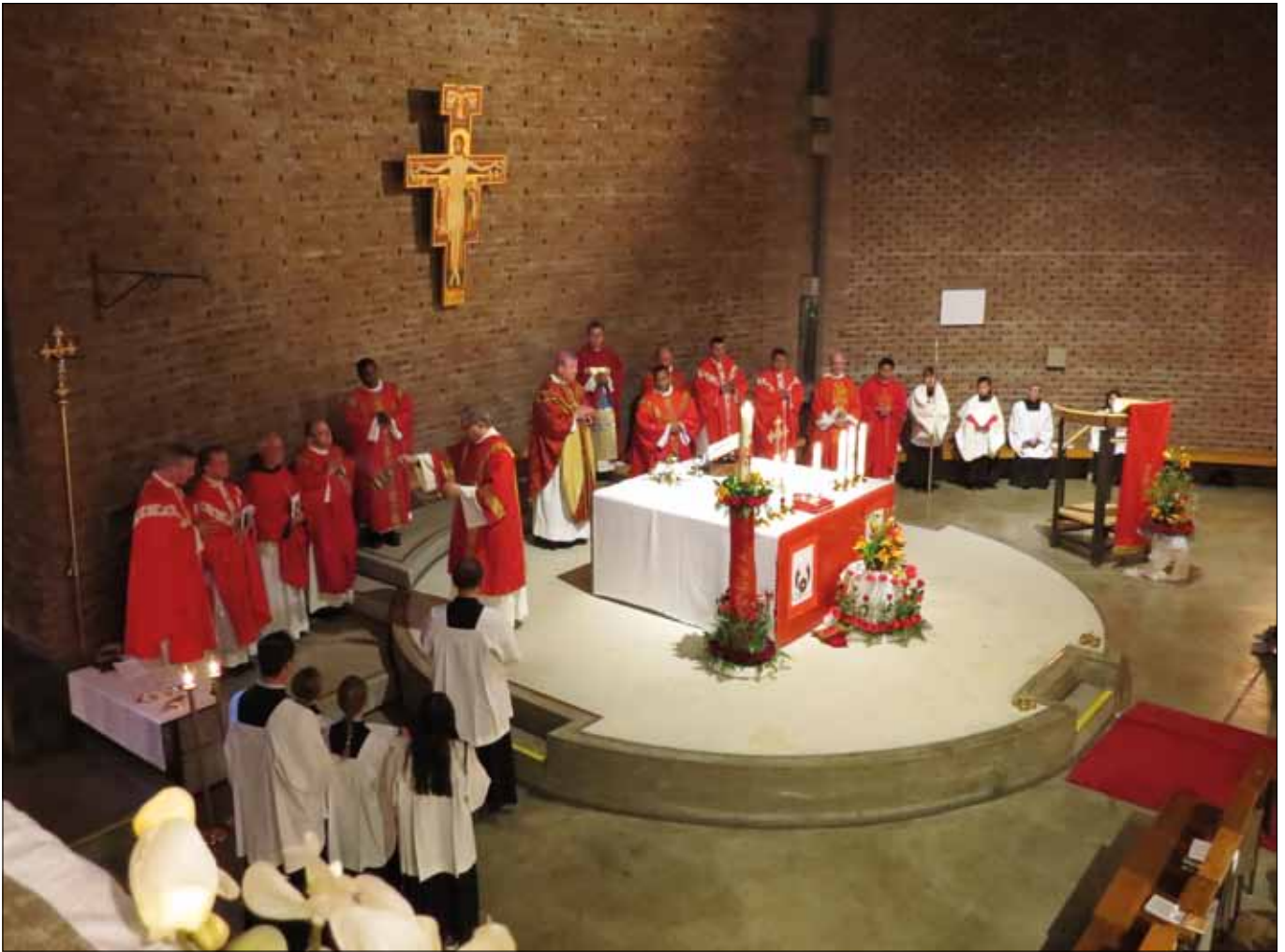
Feierlicher Gottesdienst zum 50-jährigen Bestehen der St.-Hallvard-Kirche. Der Bau ist eine architektonische Besonderheit und steht bereits unter Denkmalschutz.