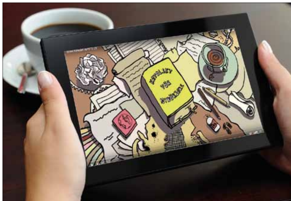
Jetzt auch auf Schwedisch: Katholisch für Anfänger.

Wer will, kann über die Konferenz eine kurze gefilmte Reportage sehen (2,5 Minuten) auf der Homepage von KPN: www.kpn.se