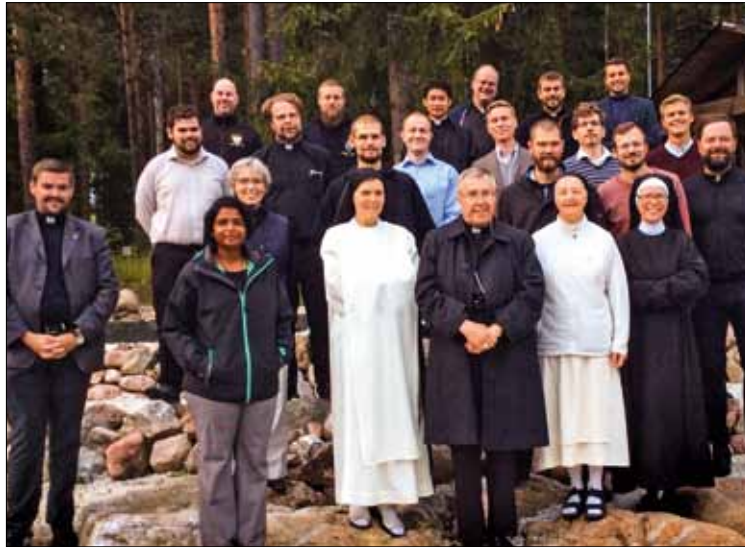
Sie bereiten sich auf den Dienst in der Kirche des Nordens vor. Die PSP-Gruppe 2016 mit Bischof Kozon aus Kopenhagen (vorne).

Am Samstag findet der traditionelle Ausflug statt. Jetzt haben diejenigen, die noch nicht miteinander gesprochen haben, die Möglichkeit, dies zu tun. An-