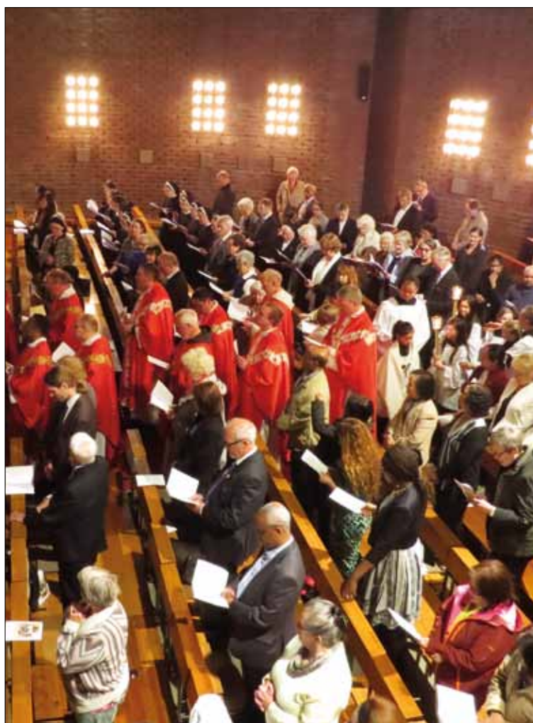
Unter den vielen Gästen war auch das Paar, das in St. Hallvard als erstes geheiratet hat und nun Goldene Hochzeit feiern konnte.

Wir als Gemeinde haben in diesem Jubiläumsjahr unseren Glauben und unsere Kirche St. Hallvard intensiver wahrgenommen. Es gab viele zusätzliche Angebote und Aktionen für alle über 15 000 Gemeinde-