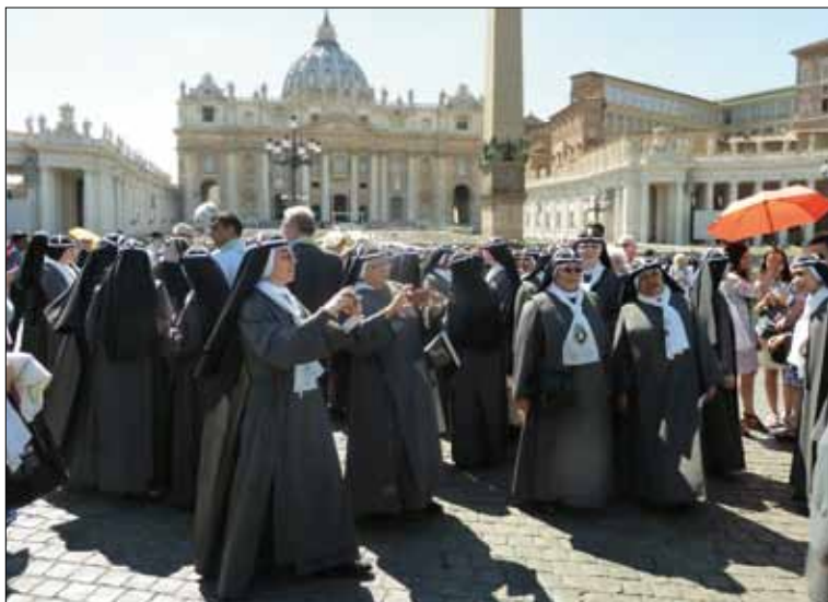
Birgittinnen aus der ganzen Welt waren auf dem Petersplatz versammelt.

Impressionen von der Feier in Rom – Von Ansgar Lüttel