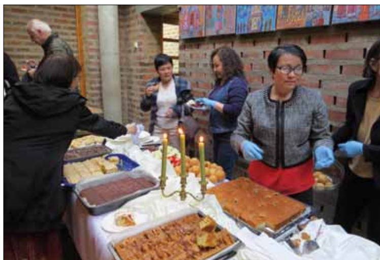
Internationaler Kirchenkaffee. Die St.-Hallvard-Gemeinde eint Katholiken aus mehr als 140 Nationen.