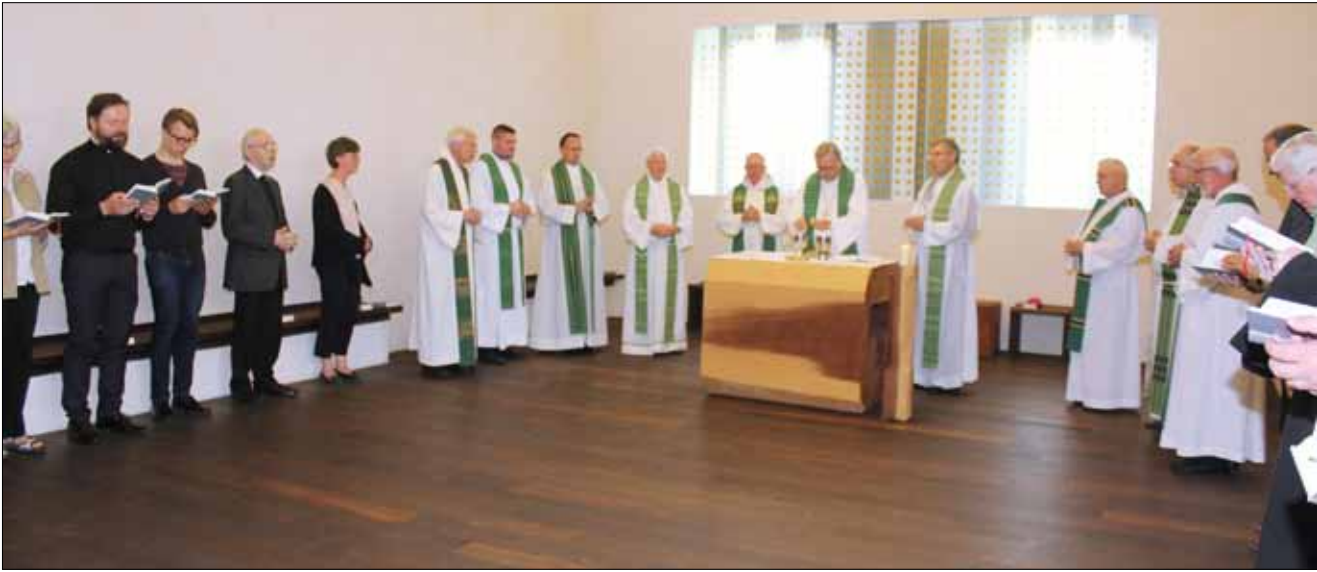
Am Abend der Begegnung feierte Bischof Franz-Josef Bode mit den Teilnehmern die Eucharistie.