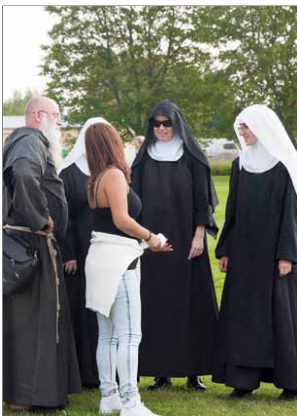
Auch Ordensleute vertiefen im Gespräch mit jungen Leuten ihren Glauben.

Diözesane Weltjugendtage in Schweden – Von Michael Franke