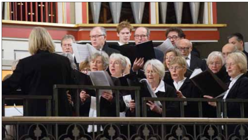
Aufführung des neuen Ansgar-Oratoriums

Da ist jeder Getaufte selbst gefragt. Die eigene Beziehung zu Christus pflegen, ihm Raum geben. Darin kann der heilige Ansgar ein Vorbild sein.