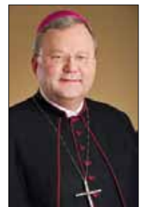
Bischof Franz-Josef Bode predigte beim Pontifikalamt am 1. Februar 2015 in der Propstei-Kirche Sankt Johann zu Bremen.

Er war als Bischof Diakon geblieben und wandte sich aufopfernd den Menschen zu. Sein Nachfolger und Biograph, Bischof Rimbert, schreibt: „Er wollte den Blinden Auge, den