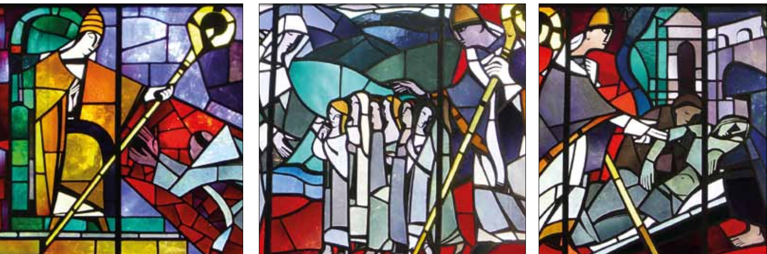
Das Leben des heiligen Ansgar, dargestellt in den Fenstern der evangelischen Ansgarii-Kirche in Bremen.

Lahmen Fuß, den Armen ein wahrer Vater sein.“ Ein Bischof also ganz im Sinne unseres heutigen Heiligen Vaters, Papst Franziskus. Ein Bischof, der bis an die Grenzen ging, bis an die Grenzen der Erde im Norden, bis dahin, wo Menschen an ihre Grenzen geraten, und bis an die Grenzen seiner eigenen Kräfte.