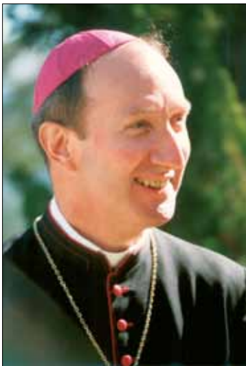
Bischof Peter Bürcher

Bischof Bürcher zieht aus gesundheitlichen Gründen ins Heilige Land – Von Dorothea Olbrich