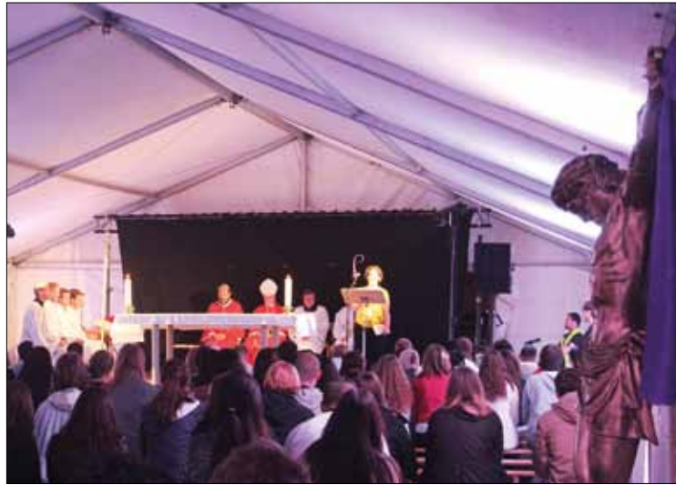
Heilige Messe mit Bischof Arborelius im Festzelt

Dani, 26: „Der Jugendtag ist einfach die beste Möglichkeit für uns, andere junge Katholiken zu treffen, miteinander den Glauben zu vertiefen und dabei noch eine Menge Spaß zu haben!“