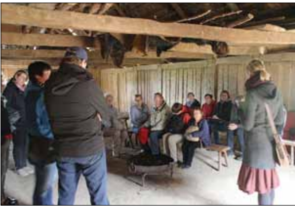
Über die Lebensgewohnheiten zur Zeit Ansgars informiert das Wikingermuseum Haithabu.