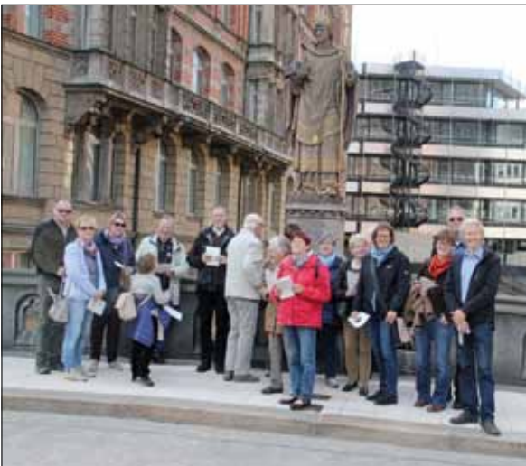
Gebetsstation bei der Ansgar-Statue auf der Trostbrücke in Hamburg

Als Bischof Helmut Hermann Wittler 1965 die neu errichtete St.-Ansgar-Kirche in Osnabrück-Nahne weihte und unter das Patronat des Apostels des Nordens stellte, geschah dies im 1100. Todesjahr des heiligen Ansgar. 50 Jahre später nahm die Gemeinde das doppelte Jubiläum zum Anlass, sich auf die Spur ihres Kirchenpatrons zu begeben. Pfarrer Hermann