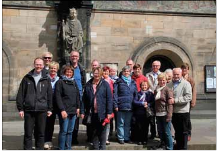
Die Pilgergruppe vor dem Bremer Dom

wir bei dieser viertägigen Wallfahrt den Radius ermessen, der das Lebenswerk des heiligen Ansgar im norddeutschen Raum kennzeichnet und bis in unsere Tage hineinreicht. Die unerschütterliche Gewissheit des Pfarrpatrons, mit Gott alles wagen und nicht(s) verlieren zu können, hat sich uns Pilgern tief eingeprägt.