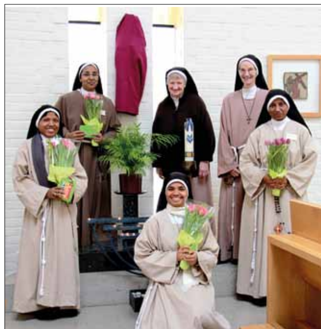
Willkommen in Larvik.

Am 14. Juni 2015 weihte Bischof Bernt das Kloster ein. Zwei Tage zuvor trafen weitere vier Schwestern aus Indien ein. Das Klarissenkloster in Larvik blüht auf.