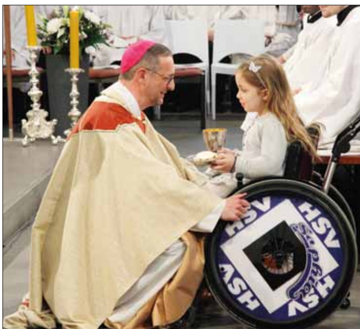
Bischof dicht bei den Menschen.

Wir wünschen uns, dass der neue Erzbischof ähnlich wie der heilige Ansgar in seiner peregrinatio pro Christi nomine, der Pilgerschaft in der Fremde für den Namen Christi, auch dem Ansgar-Werk hilft, weitere stabile Brücken in den hohen Norden zu bauen – 1150 Jahre nach Ansgars Tod.