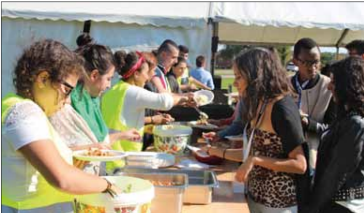
Ehrenamtliche helfen bei der Essensausgabe